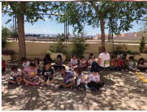
Día del libro. AL AIRE LIBRO